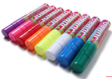
SCRITTO® CHALKMARKERS KREIDESTIFT